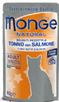
Tuncis ar lasi