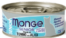
SENIOR Dzeltenspuru tuncis ar anšovjiem