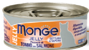
Tuncis ar lasi