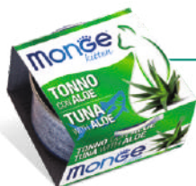
Tuncis ar alveju