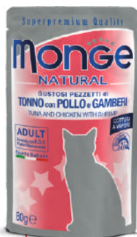
Tuncis un cālis ar garneļēm