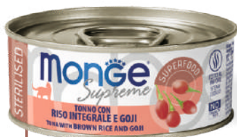
STERILISED Tuncis ar brūnajiem rīsiem un godži

Papildinoša barība bez pievienotām krāsvielām un konservantiem un bez cietsirdības testa.