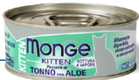
KITTEN Tuncis ar alveju