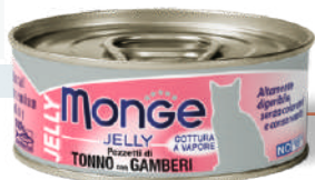
Dzeltenspuru tuncis ar garnelēm