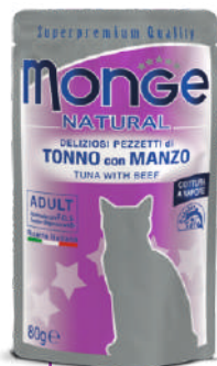
Tuncis ar liellopu