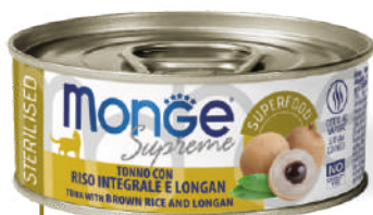
STERILISED Tuncis ar brūnajiem rīsiem un longanu