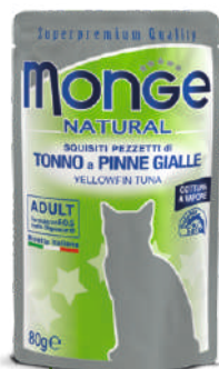
Klusā okeāna Tuncis