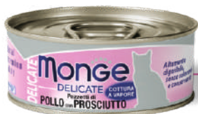
Cālis ar šķiņķi