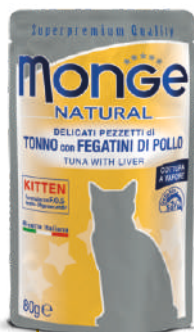
Tuncis ar garneļēm