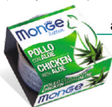
Cālis ar alveju

Monge Fruits sastāv no 12 delikatesēm , kas ideāli piemērotas izvēlīgo kaķu izsmalcinātajai gaumei: Atlantijas un Klusā okeāna tunzivis gabaliņi, vistas gaļa ar eksotiskiem augļiem un alveja , lai garantētu līdzsvarotu barības vielu daudzumu. Receptēs ietilpst F.O.S. (frukto-oligosaharīdi) zarnu trakta labklājībai. Papildinoša barība bez pievienotām krāsvielām un konservantiem. Produktu klāsts piedāvā divas receptes kaķēniem un desmit receptes pieaugušiem kaķiem.