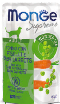
ADULT Tuncis ar zaļajiem zirņiem un mazo kukurūzu