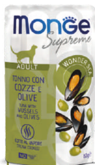
ADULT Tuncis ar mīdijām un olīvēm