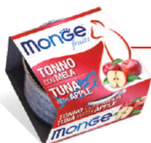
Tuncis ar ābolu