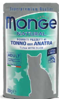
Tuncis ar pīli