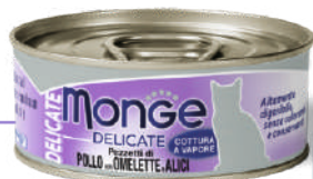
Cālis ar omleti un anšoviem