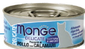
Cālis ar kalmāru