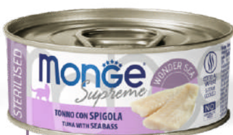
STERILISED Tuncis ar jūras asari