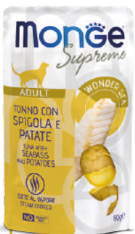
ADULT Tuncis ar jūras asari un kartupeļiem