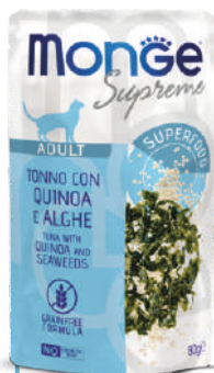
ADULT Tuncis ar kvinoju un jūraszālēm