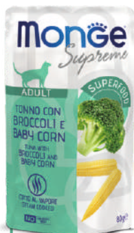
ADULT Tuncis ar brokoļiem un mazo kukurūzu

Ekskluzīvas receptes, kas izstrādātas ar svītraino tunzivi, superproduktiem , piemēram, burkāniem, spinātiem, zirņiem, brokoļiem, kā arī kvinoju, jūraszālēm un izmeklētām zivīm , piemēram, jūras asari, kefali un mīdijām daudzveidīgai un sabalansētai diētai. Papildinoša barība bez pievienotām krāsvielām un konservantiem un bez cietsirdības testa.