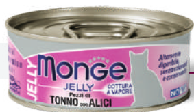
Dzeltenspuru tuncis ar anšovjiem