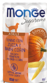
ADULT Tuncis ar ķirbi un mazo kukurūzu