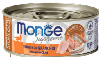
STERILISED Tuncis ar krabi