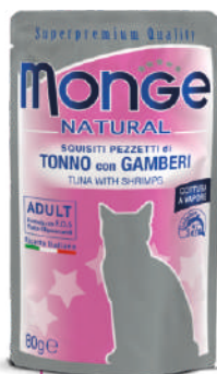
Tuncis ar aknām