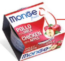
Cālis ar ābolu