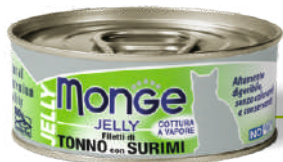
Dzeltenspuru tuncis ar surimi