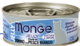
Dzeltenspuru tuncis ar jūras plaudi