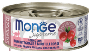
STERILISED Tuncis ar brūnajiem rīsiem un dzērvenēm