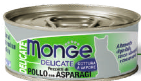
Cālis ar sparģeļiem