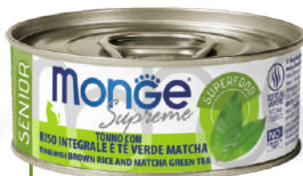
SENIOR Tuncis ar brūnajiem rīsiem un Matcha zaļo tēju