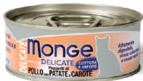
Cālis ar kartupeļiem un burkāniem