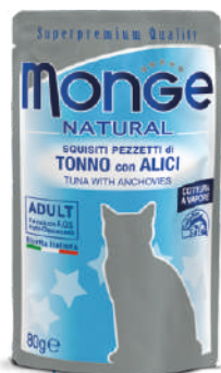
Tuncis ar anšovjiem